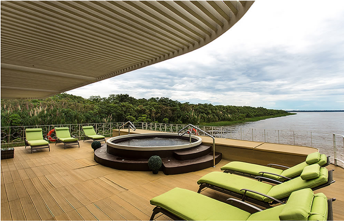
Delfin III