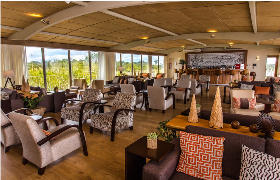
Delfin III