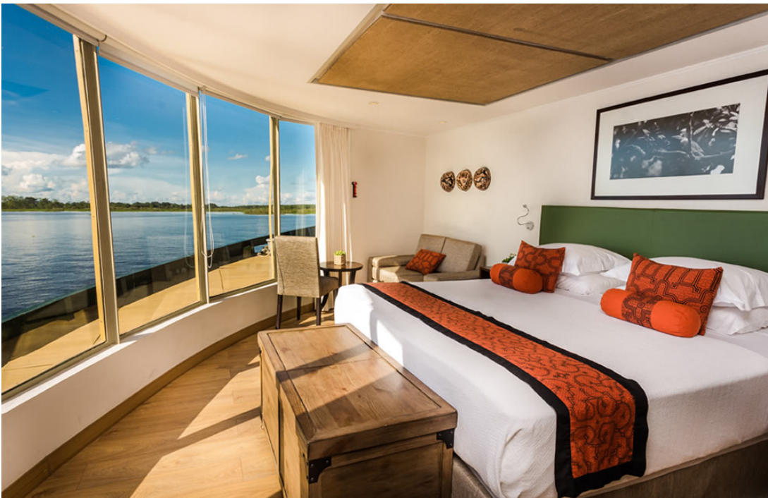
Owners Suite auf der Delfin III

? Zusammen mit seinen Kindern hat Markus Mathys die Delfin-Schiffe auf dem Amazonas im Oktober 2023 besucht. Fotos dieser Perureise unter diesem LINK .