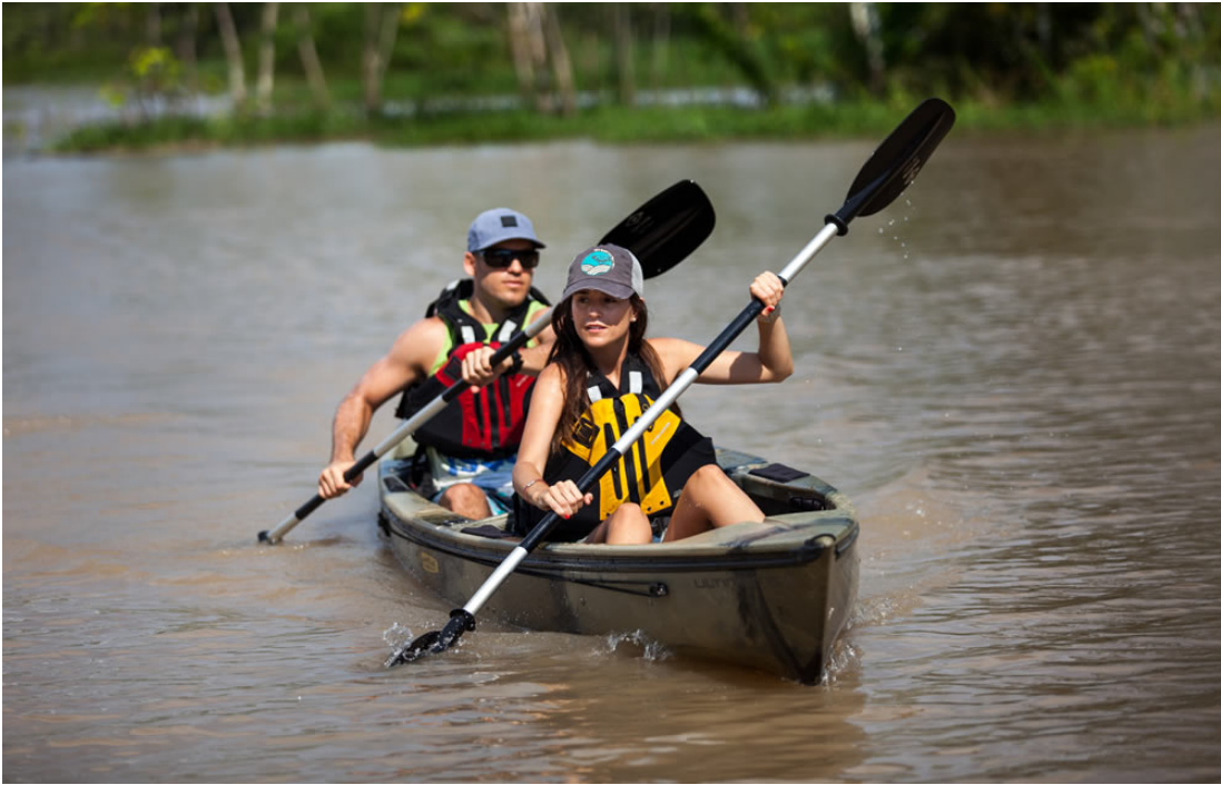
Kanufahren auf dem Amazonas