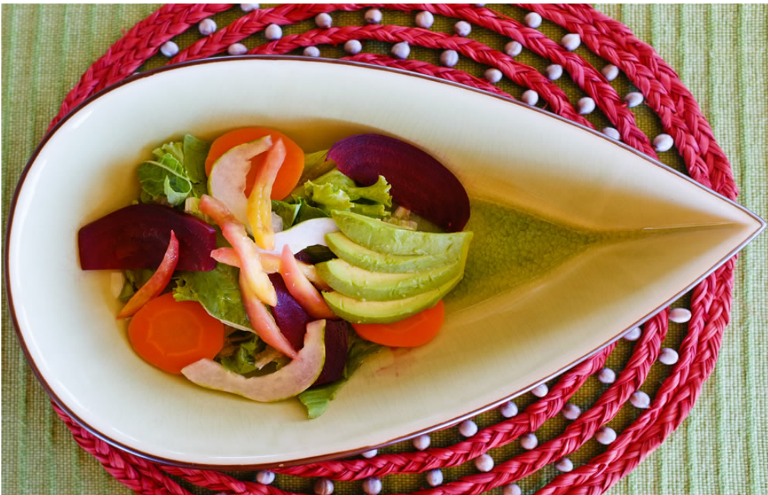
Delfin III