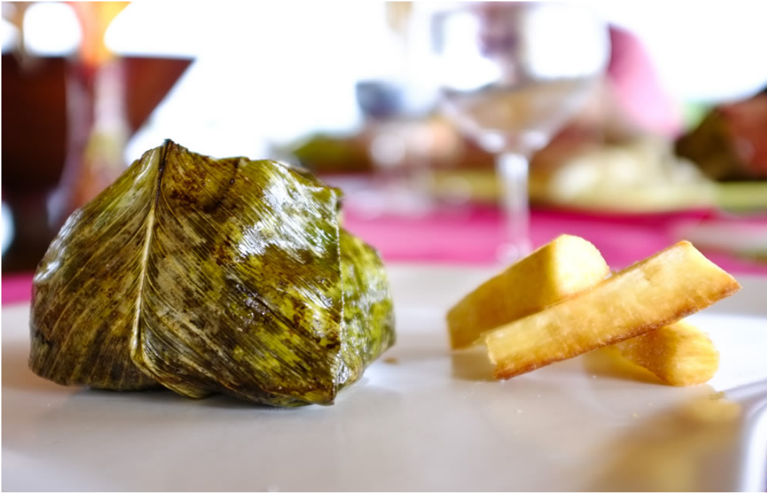
Delfin III