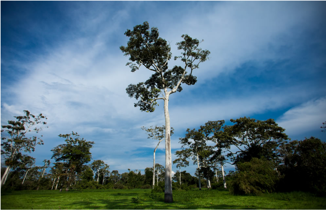
Schwemmland des Pacaya Samiria Reservats in Peru